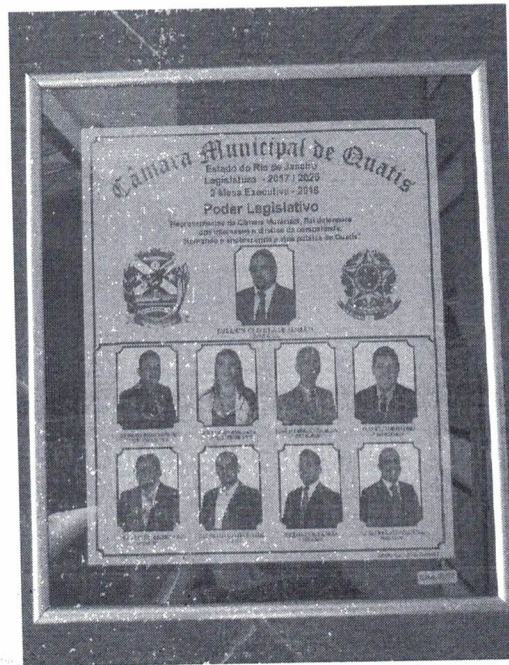
MODELO MEMORIAL LEGISLATIVO 63,5CM X 53,0CM (ALTURA X BASE)