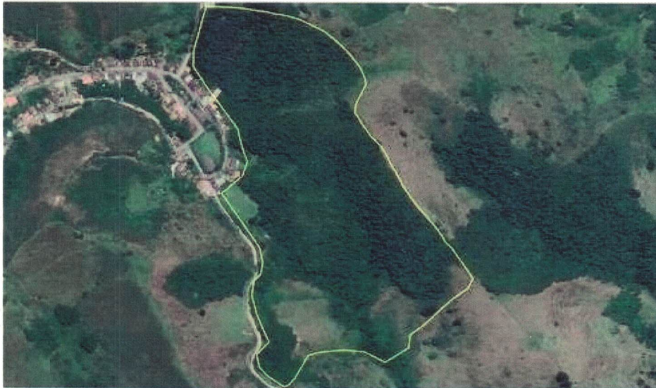
MAPA PERÍMETRO DO PARQUE NATURAL MUNICIPAL DE RIBEIRÃO DE SÃO JOAQUIM